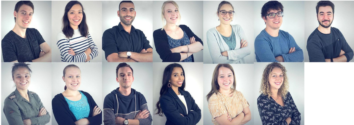
L'équipe de Selectos

Mais derrière d'autres plateformes, il y a de vraies personnes, des employés, une histoire. Selectos c'est une jeune start-up belge qui, en l'espace de deux ans, est passée de 0 à 12 employés (principalement de jeunes diplômés), dont la place est actuellement mise en péril par les lois de la jungle du web !